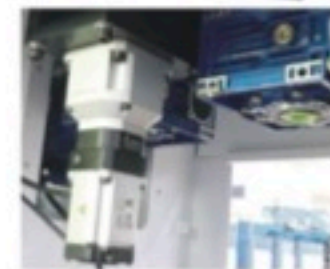
弯折电机与冲切动力电机 Bending Motor Cutting Motor