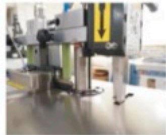
高精度折弯剪切 High Precision Bending Cutting Set