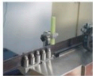
刀材调节组 Rule Adjustment Group